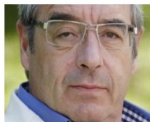
Pascal PICQ Paléoanthropologue au Collège de France