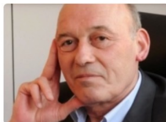
Hugues de JOUVENEL Président d'honneur Futurible int. Fondateur revue Futuribles