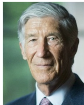
Joël de ROSNAY Prospectiviste Conseiller Universcience